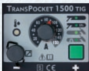
Soldadura manual hasta 140 A, soldadura TIG perfecta hasta 150 A, válvula magnética de gas y conexión de mando a distancia