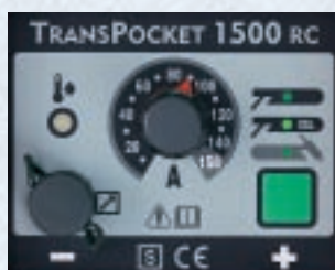
Soldadura manual hasta 140 A y función adicional TIG hasta 150 A, así como conexión al mando a distancia