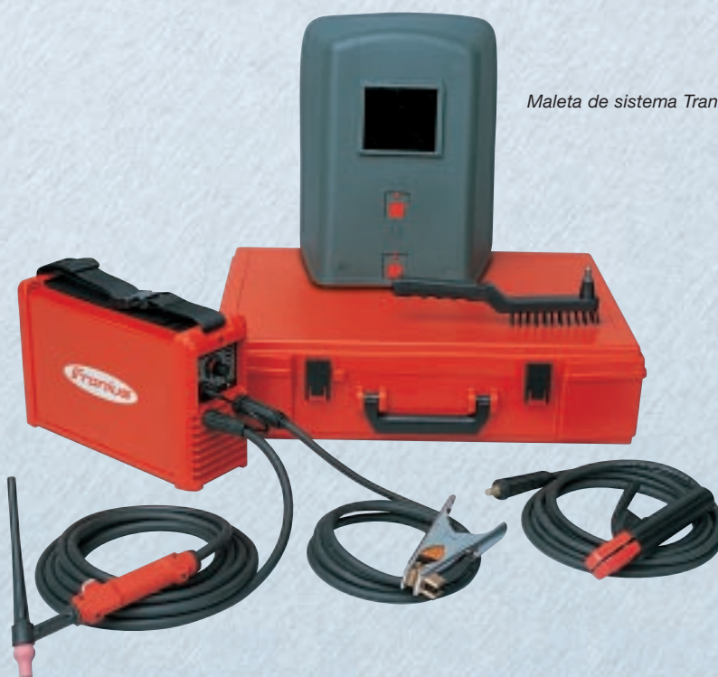
Maleta de sistema TransPocket 1500 TIG

Además, Fronius también ofrece la denominada «maleta de sistema», es decir, equipos de soldadura provistos de un completo equipamiento para el puesto de soldadura: cable de electrodo, cable de masa, pantalla protectora, cepillo de alambre y martillo para quitar la escoria de -cubilote.