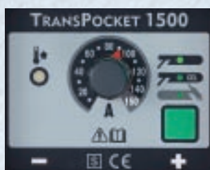
Soldadura manual hasta 140 A y función adicional TIG hasta 150 A