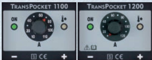
Los equipos más pequeños y ligeros de esta clase: 3,7 kg. con una potencia de 110 A ó 120 A