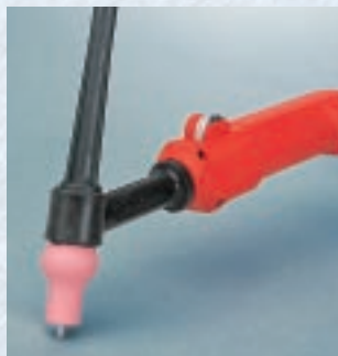
Antorcha de soldadura AL 1500 para TP 1500 TIG con posibilidad de regular la corriente de soldadura directamente desde la empuñadura de la antorcha

Los equipos son diseñados para su uso con todo tipo de electrodos, incluso con los más exigentes. Los materiales base adecuados son acero, aceros altamente aleados, así como aluminio. Su versatilidad les hace idóneos para ser usados en cualquier sector de la industria, con grandes resultados.