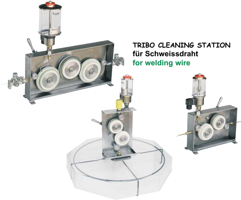
TRIBO CLEANING STATION für Schweißdraht for welding wire